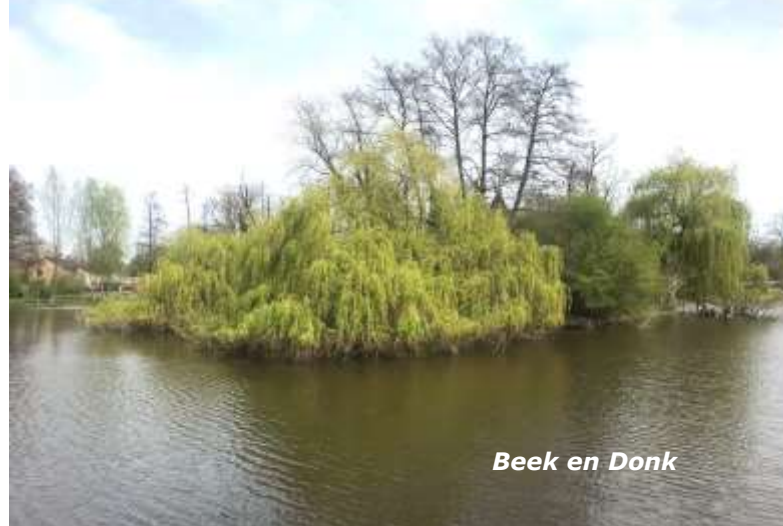
Beek en Donk

Wist je trouwens dat Guus Meeuwis in Lieshout opgegroeid is?