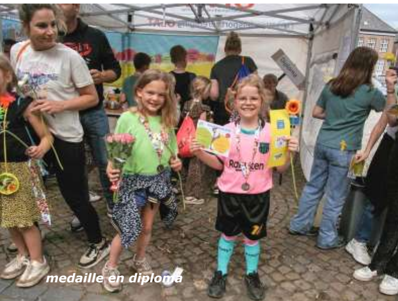
medaille en diploma