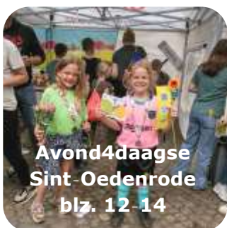
Avond4daagse Sint-Oedenrode blz. 12-14