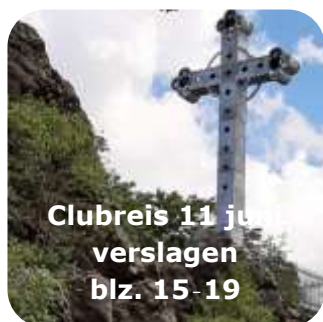
Clubreis 11 j verslagen blz. 15-19