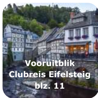
Vooruitblik Clubreis Eifelsteig blz. 11