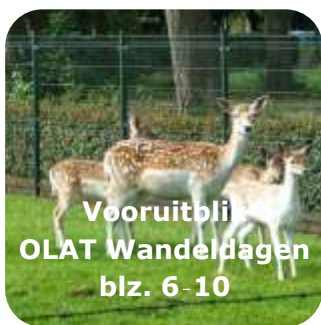
Vooruitblik OLAT Wandeldagen blz. 6-10